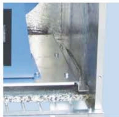
Monteret på vibrationsdæmpere