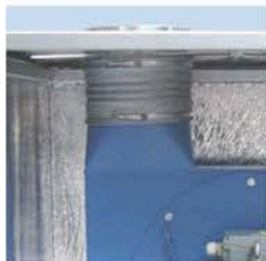
Fleksforbindelse - kun for ren luft.